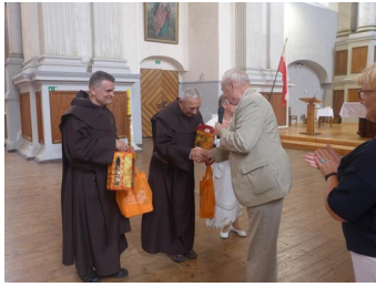
Księża z Kowna którzy celebrowali msze św. w polskim języku.