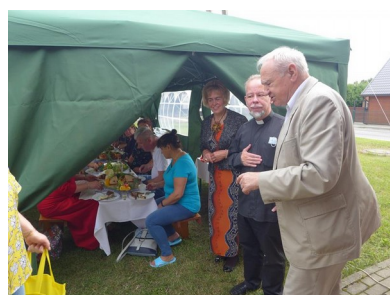
Proboszcz z Wędziagoły