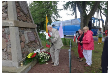
Wodokty – składanie kwia- tów pod obeliskiem WK Wi- 4-7-2-