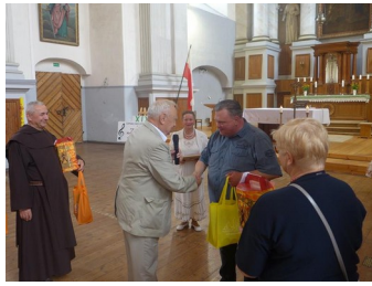
Proboszcz parafii w Datnowie.