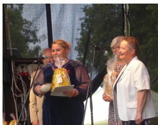
Starosta Gminy Pacunelle