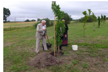
Wodokty – Park Dębów Przyjaźni Polsko-Litew- skiej, dosadzanie brakują- cych dębów.