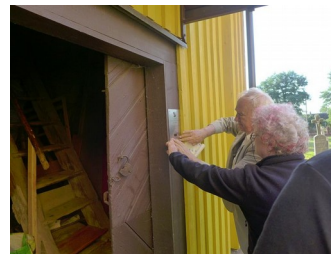
Mocowanie tabliczki upamiętniającej naszą wizytę w Wędziagole w 300 rocznicę zawieszenia dzwonu.