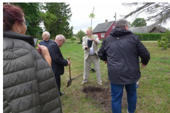
Sadzenie dębu zWęgorzewa