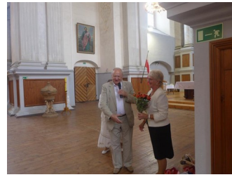
Działaczka ZPL z Poniewierza.