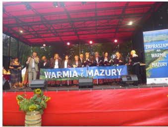
Chór Ojczyzna na scenie w Pacunelach.